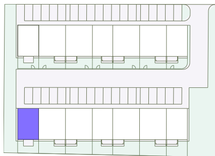
ul. Mieleńska, Pokość