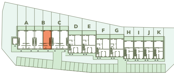
Wspólna 25-45, Kruszwica