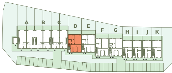
Wspólna 25-45, Kruszwica