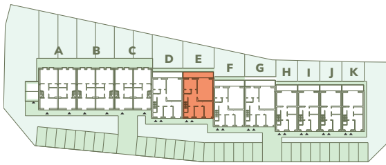
Wspólna 25-45, Kruszwica