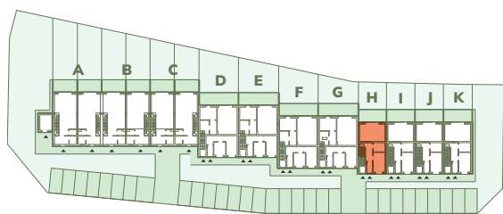
Wspólna 25-45, Kruszwica