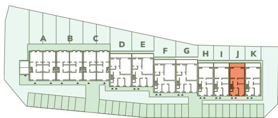
Wspólna 25-45, Kruszwica