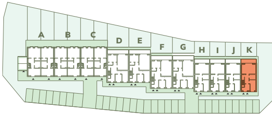
Wspólna 25-45, Kruszwica